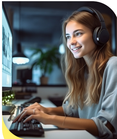
ADMINISTRATIEF & OFFICE