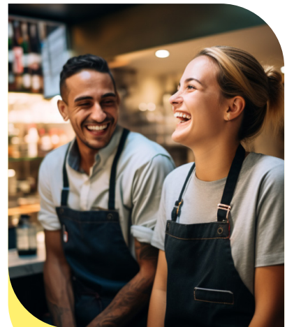
HORECA & CATERING